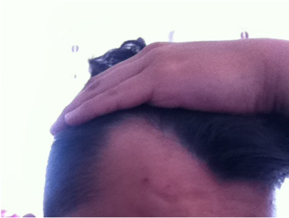
3) IMG_6789.JPG , downloaded 606 times