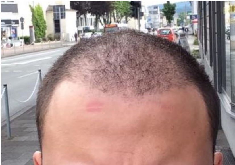
2) 11262939_852172521504366_1066212546_n.jpg , downloaded 490 times