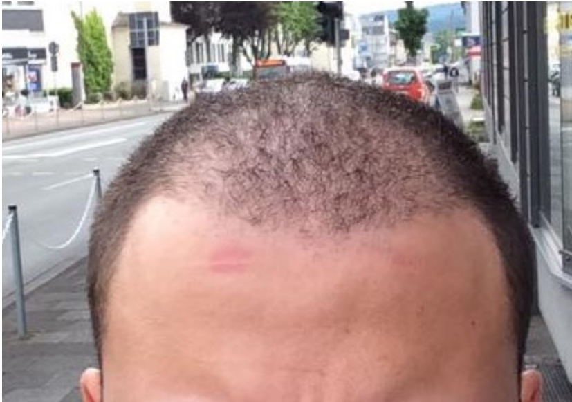
2) 11262939_852172521504366_1066212546_n.jpg , downloaded 496 times