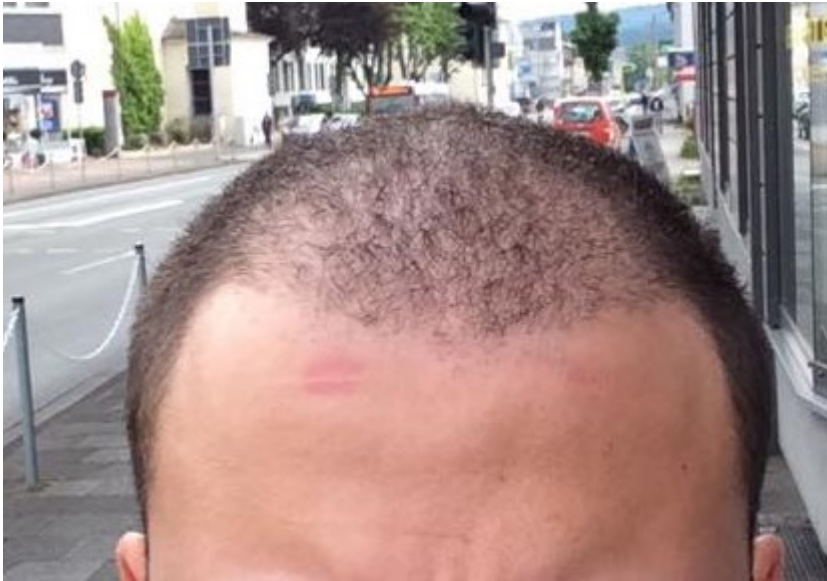
2) 11262939_852172521504366_1066212546_n.jpg , downloaded 494 times