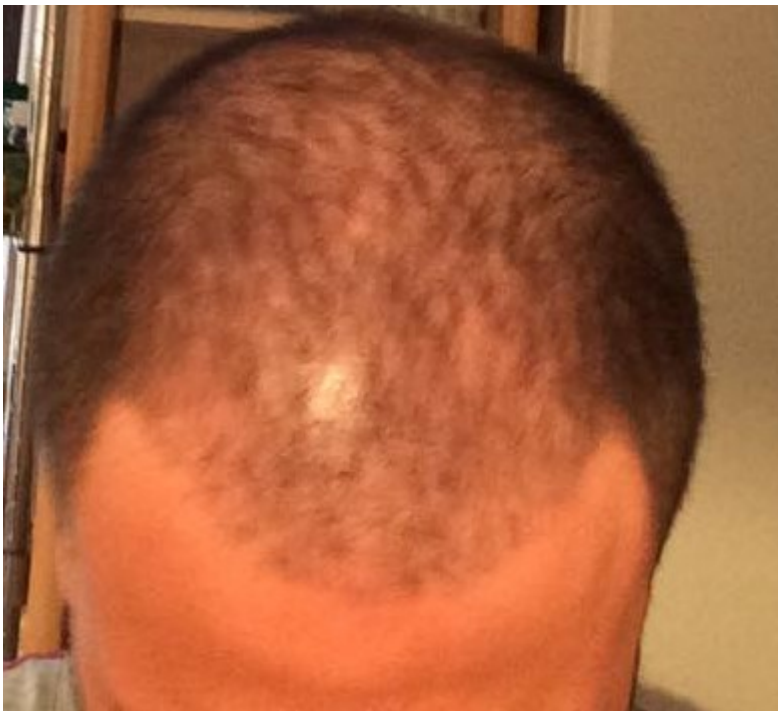
3) 11297755_852174341504184_1305390297_n.jpg , downloaded 465 times