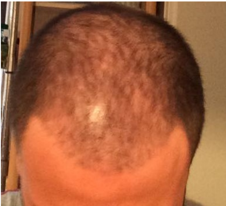
3) 11297755_852174341504184_1305390297_n.jpg , downloaded 465 times