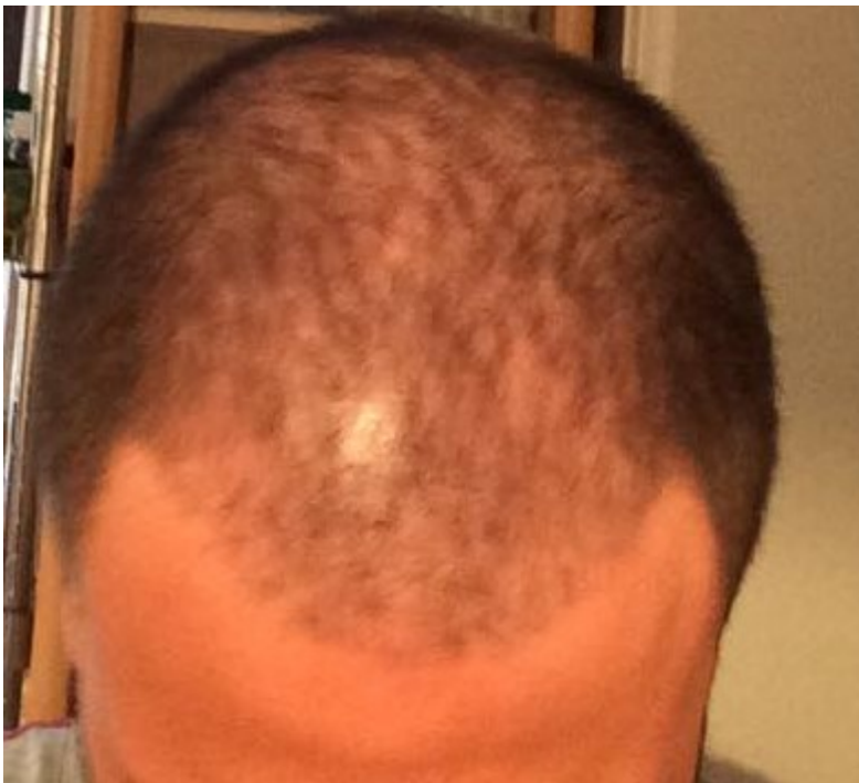
3) 11297755_852174341504184_1305390297_n.jpg , downloaded 460 times