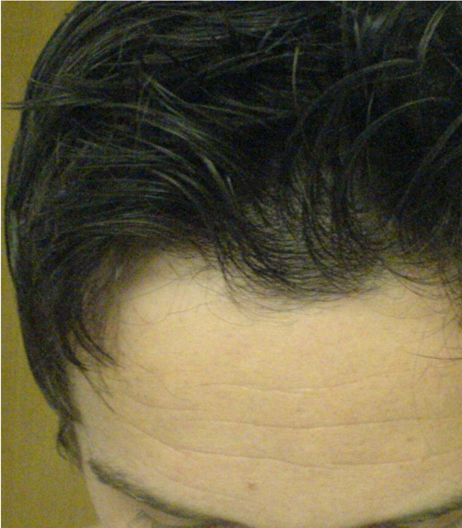
3) TROCKEN GE.jpg , downloaded 465 times