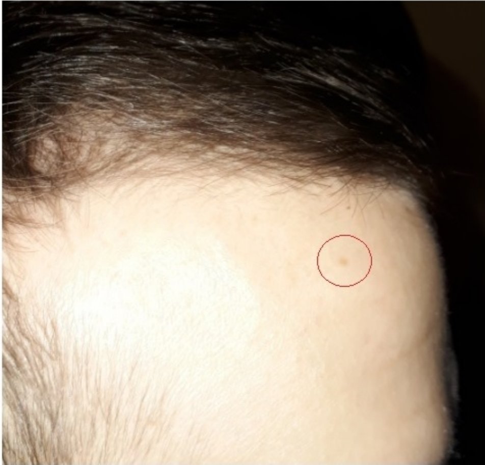
1 Feb. 2019 Start Needling