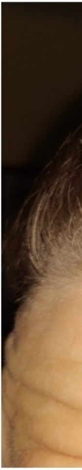
1 Feb. 2019 Start Needling