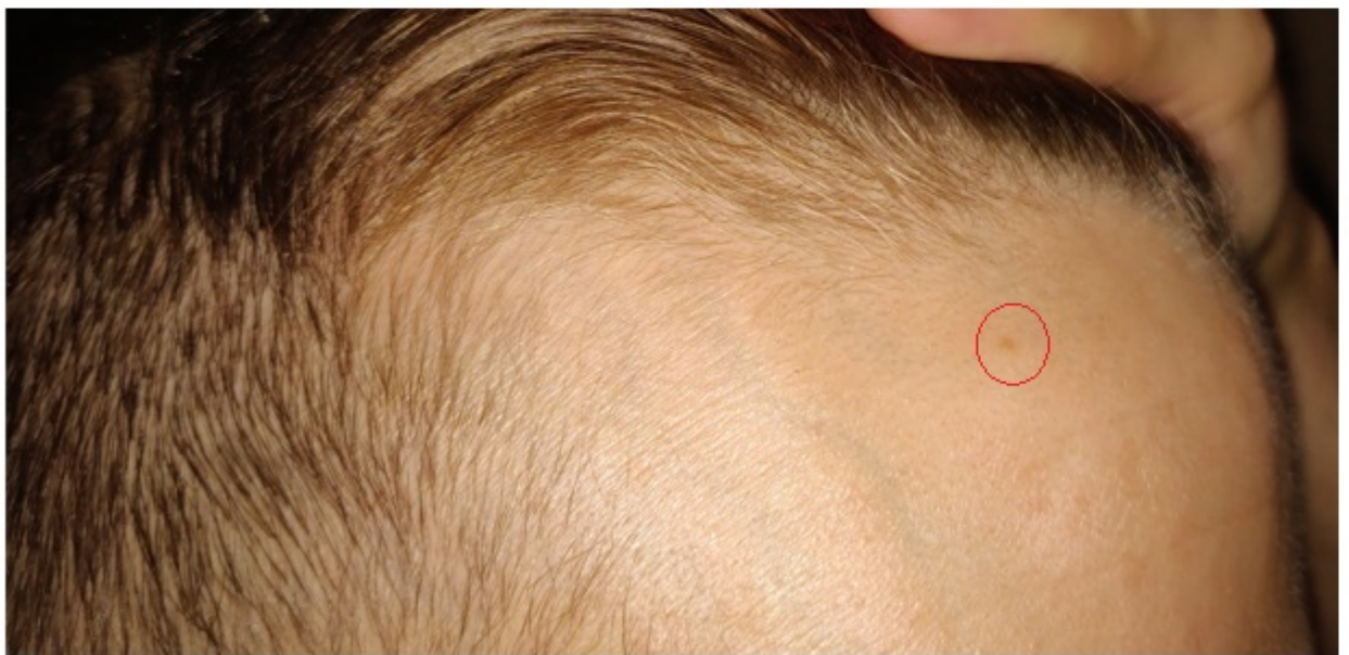
22. Jan 2022