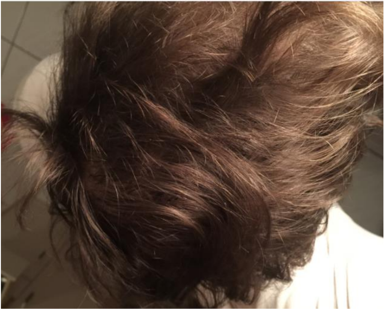
3) 2015.jpg , downloaded 506 times