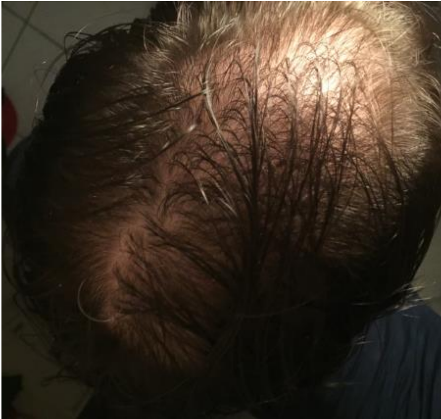
2) Oberkopf, nasse Haare.jpg , downloaded 786 times