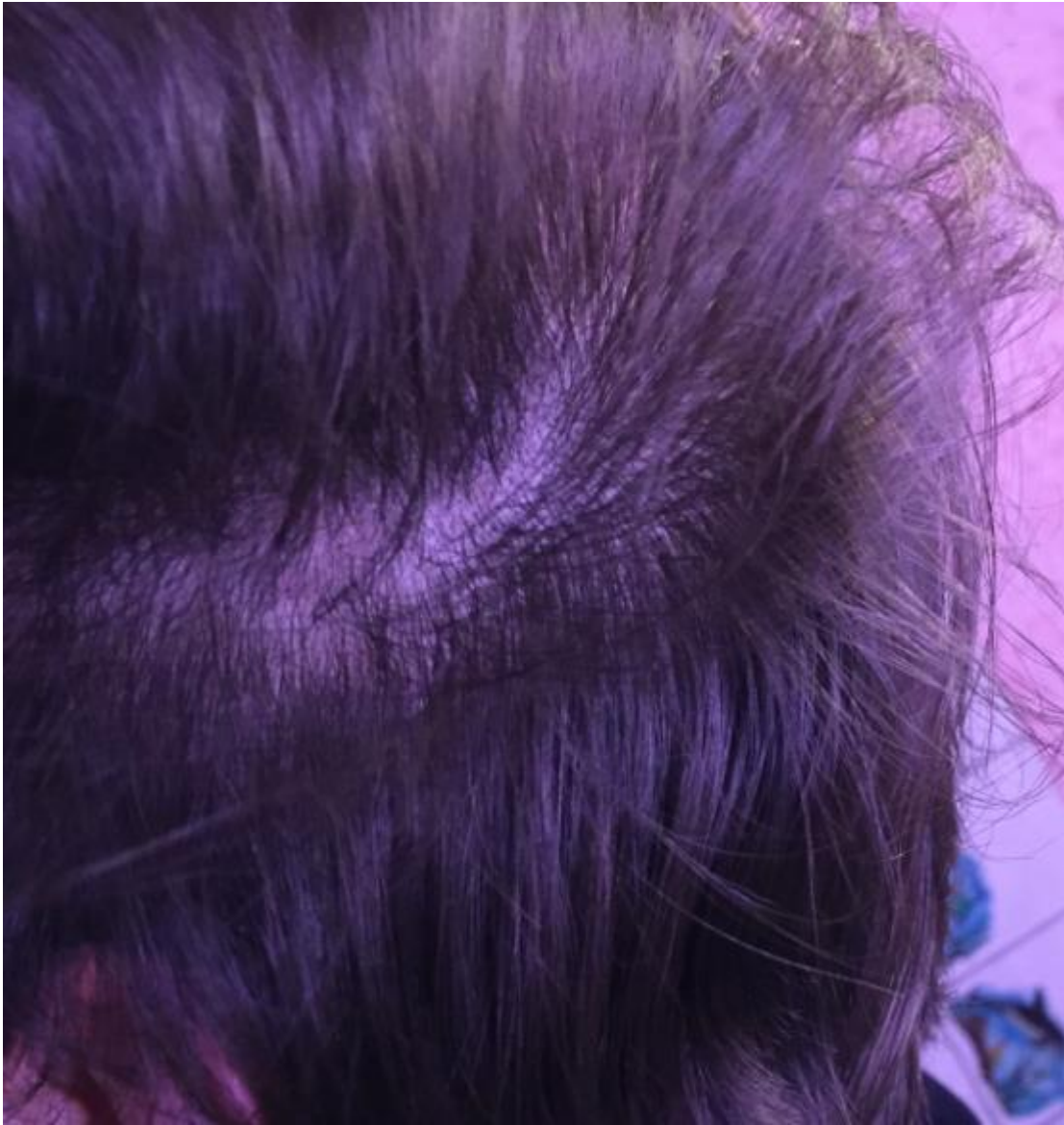
2) zurückgekemmt.jpg , downloaded 430 times