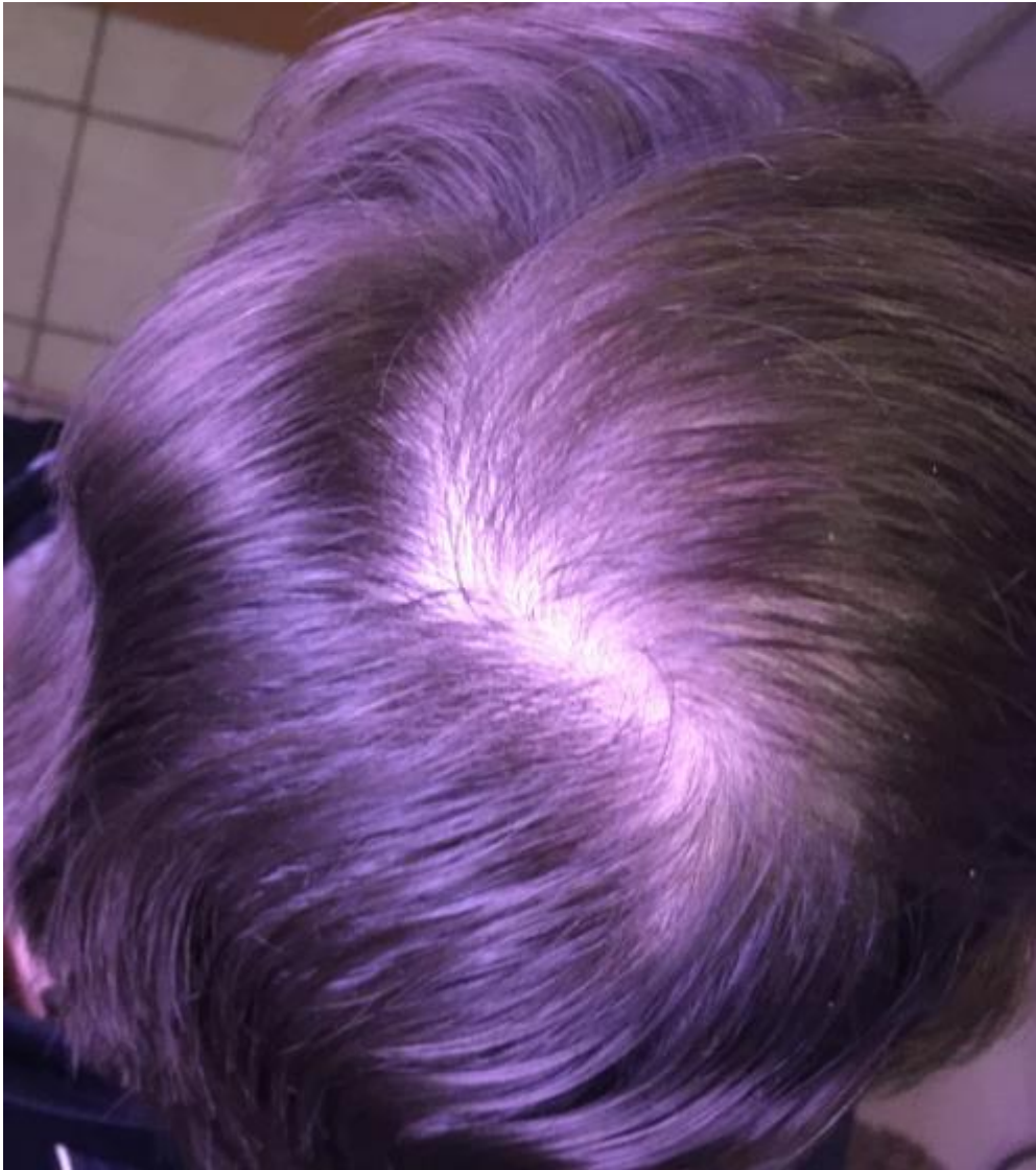
3) zurückgekemmt.jpg , downloaded 642 times