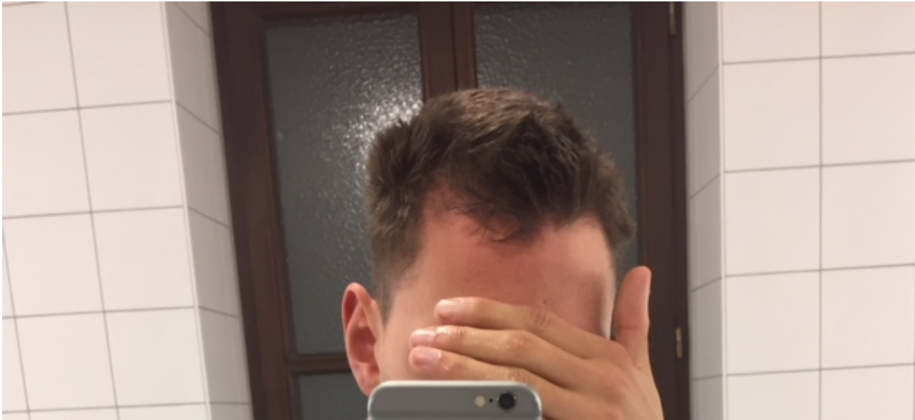
3) 3.JPG , downloaded 350 times