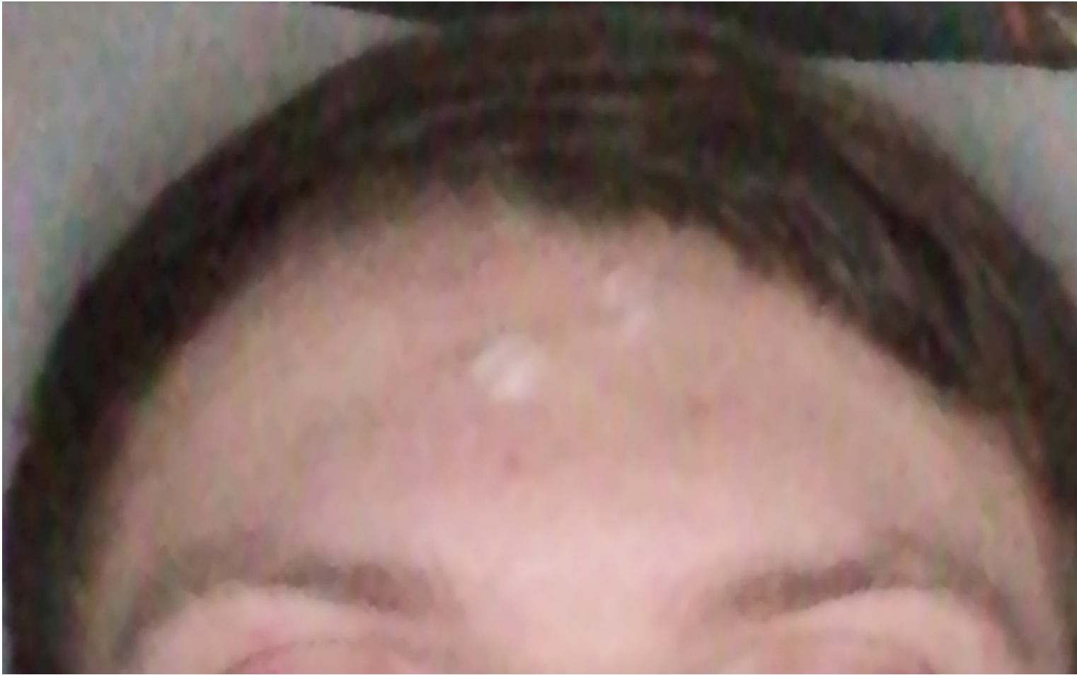
2) IMG_20210709_194447.jpg , downloaded 284 times