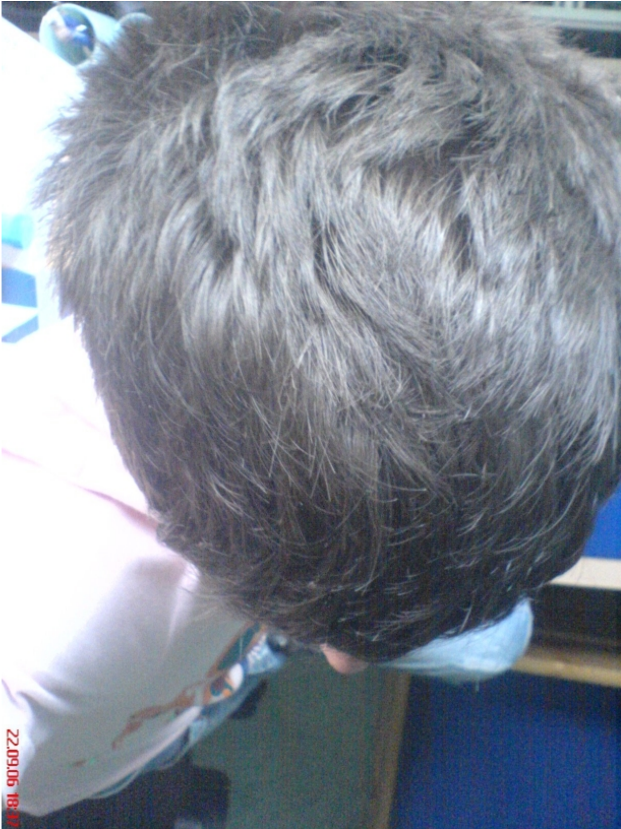
3) DSC01087.JPG , downloaded 332 times