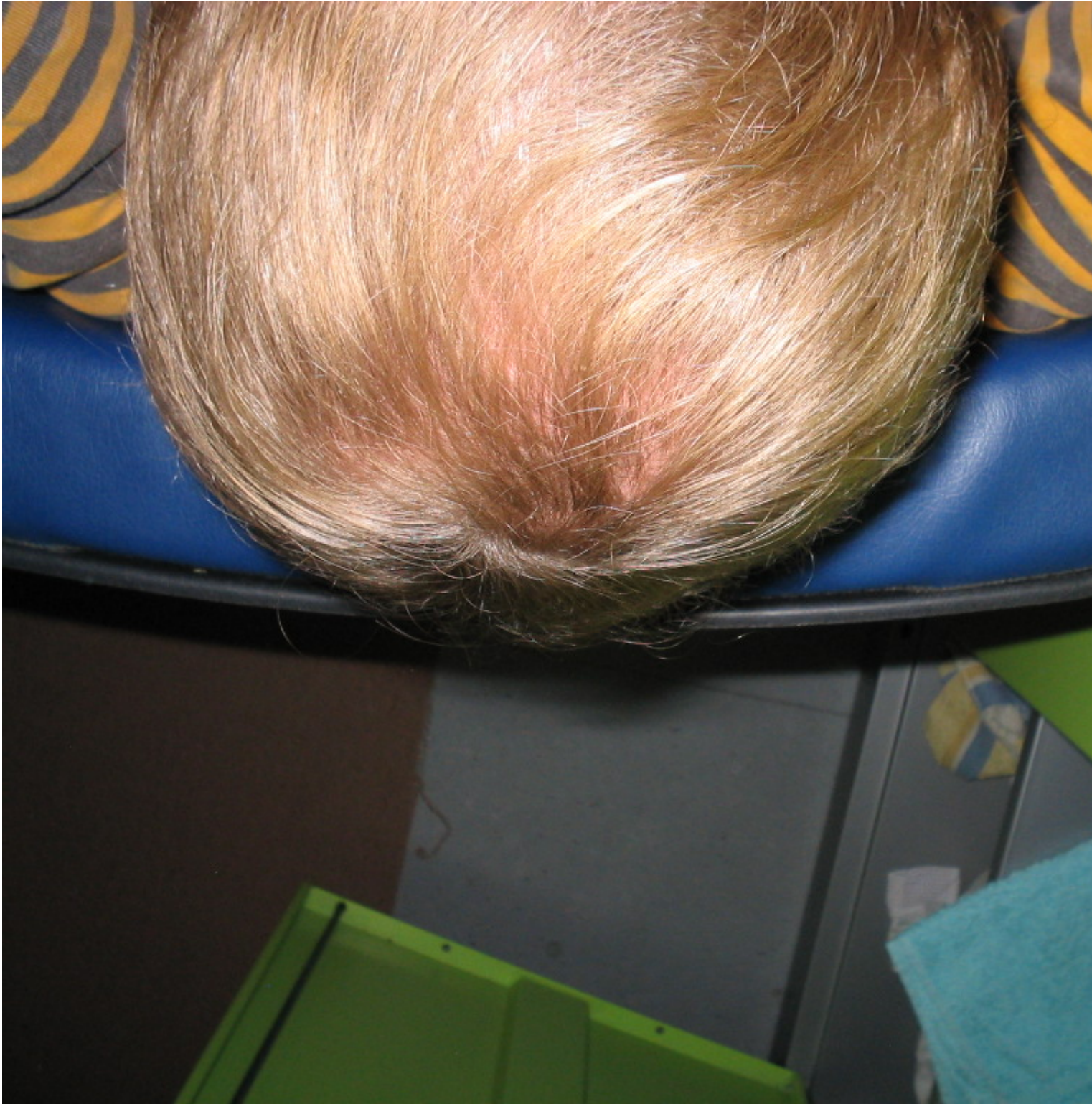
3) IMG_0186.jpg , downloaded 2863 times