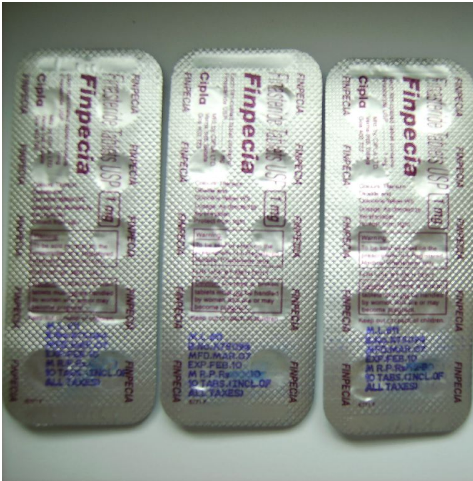
3) PICT0040_1024x1024_500KB.jpg , downloaded 3826 times