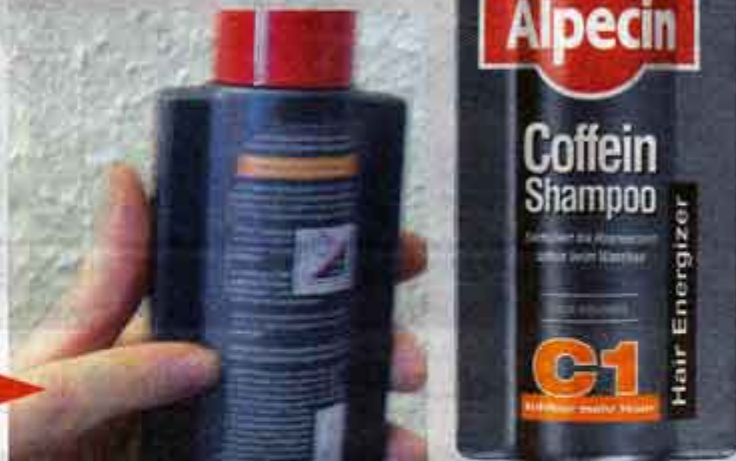
Das erste Shampoo mit Coffein macht müde Haarwurzeln munter, sogar erblich bedingter Haarausfall wird gestoppt