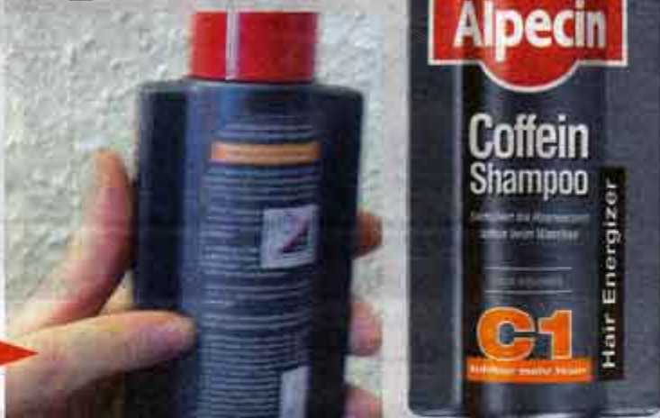
Das erste Shampoo mit Coffein macht müde Haarwurzeln munter, sogar erblich bedingter Haarausfall wird gestoppt